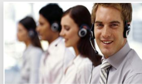
Kompetente Beratung durch unsere qualifizierten Kundenberater

Gerne erstellen wir Ihnen ein individuelles Angebot. Rufen Sie uns an unter Tel.: +49 (0)7 11-4 90 90-82! Oder mailen sie uns an fax@gtc.net . Möchten Sie gleich einen Auftrag übermitteln? Gerne übersenden wir Ihnen die dafür nötigen Unterlagen und realisieren auch ihre kurzfristigen Aktionen!